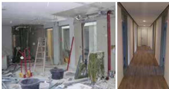
Vorher – Nachher: Handwerker schaffen die Voraussetzungen für eine moderne Büroetage.

Das Handelshaus ist jetzt jedenfalls wieder komplett vermietet, es erstrahlt in neuem Glanz und die Bürogemeinschaft wächst Schritt für Schritt zusammen. □