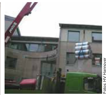
Bauaktionen am Handelshaus in der Hinüberstraße in Hannover.